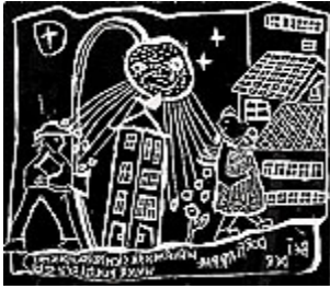
Bei der Dorflaterne