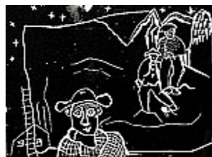
(aus den Bergen ins Tal)